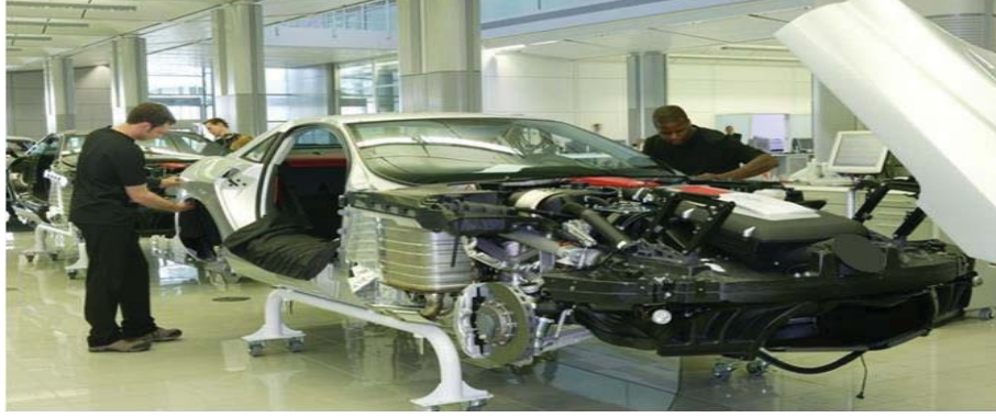
Otomotiv üretim bandı